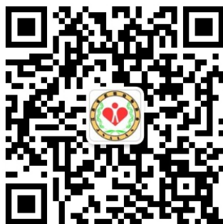
微信公众号二维码

2、邮件报名：请填写报名表（附件1），将报名表发送至邮箱 85485879@163.com。